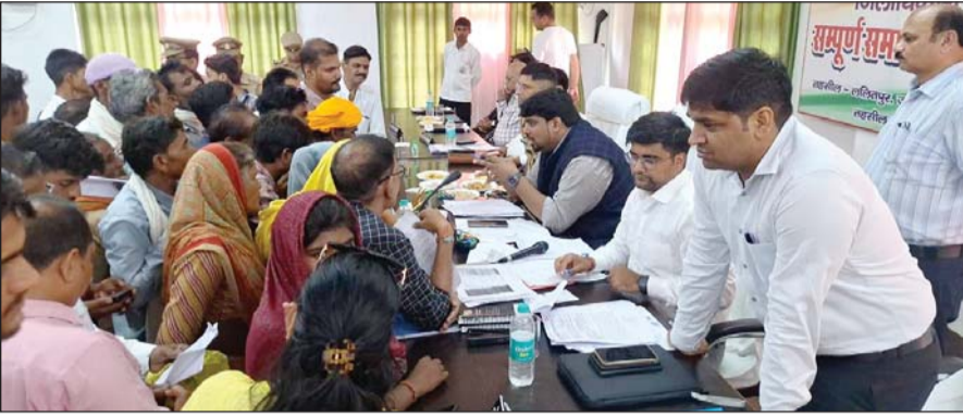
ललितपुर। सम्पूर्ण समाधान दिवस में जनसमस्यायें सुनते डीएम-एसपी।