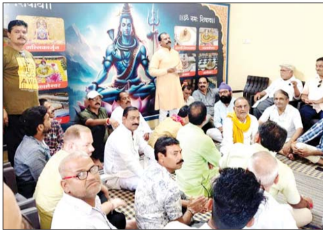
ललितपुर। जल विहार पर्व की तैयारी बैठक में मंथन करते पदाधिकारी।

ललितपुर। श्रीरामलीला हनुमान एवं पुजारियों एक बैठक तालाबपुर जयंती महोत्सव समिति की व नगर के स्थिति धनुषधारी मंदिर पर अशोक गणमान्य नागरिकों, मंदिरों के प्रबंधक पटैरिया की अध्यक्षता में संपन्न हुई,