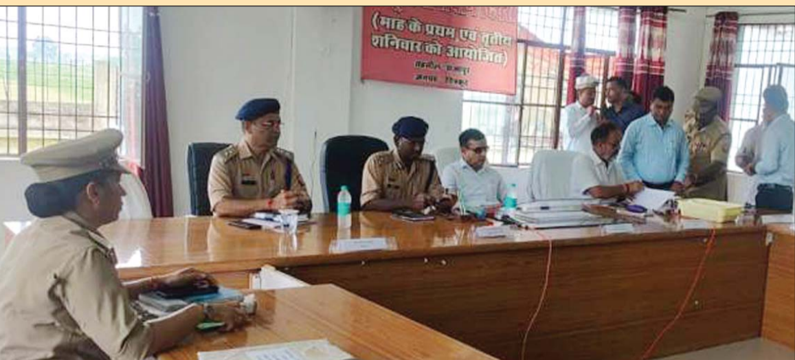
चित्रकूट। फरियादियों की समस्या सुनते मंडलायुक्त व डीआईजी।

सम्पूर्ण समाधान दिवस में मंडलायुक्त-डीआईजी ने सुनी फरियाद