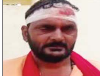
चित्रकूट। मारपीट में घायल श्रद्धालु।