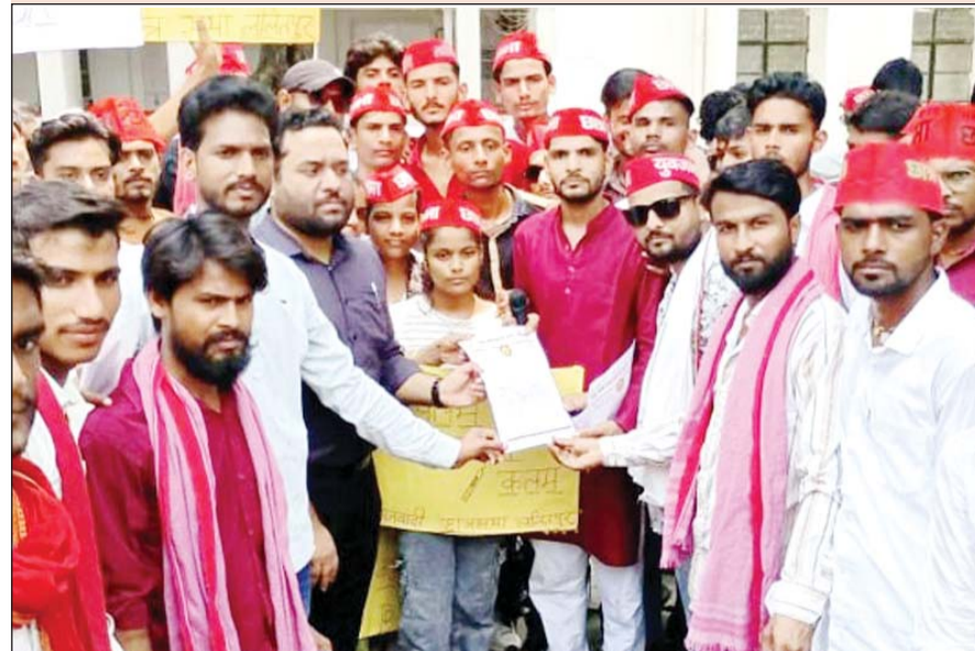
ललितपुर। राज्यपाल को सम्बोधित ज्ञापन प्रशासन को सौंपते छात्रसभाई।

समाजवादी छात्रसभा ने प्रदर्शन कर राज्यपाल को भेजा ज्ञापन