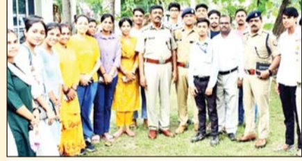
ललितपुर। विद्यार्थियों के साथ एडीजी।