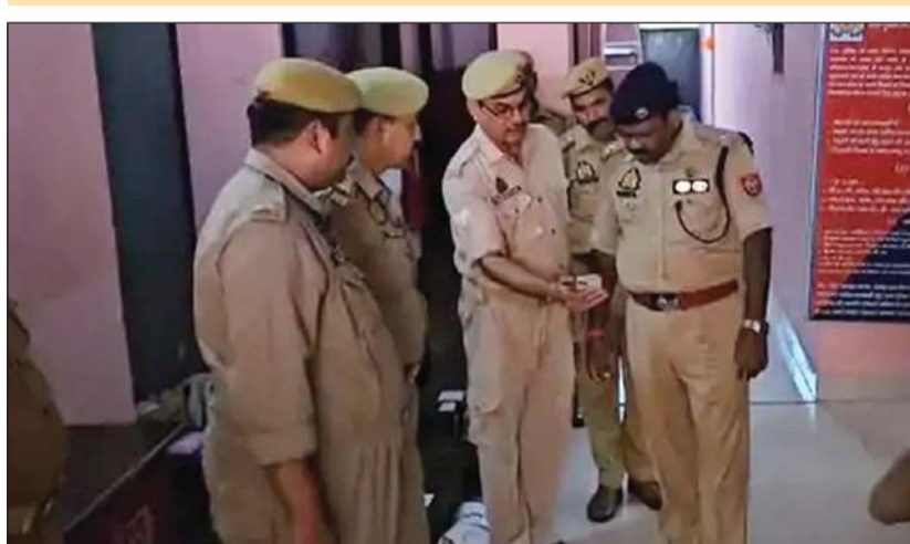
मोट। झांसी के वरिष्ठ पुलिस अधीक्षक बीबीजीटीएस मूर्ति ने सोमवार को मोट कोतवाली का

एसएसपी ने की व्यवस्थाओं की जांच, वांछित अपराधियों की गिरफ्तारी में लापरवाही पर चेतावनी