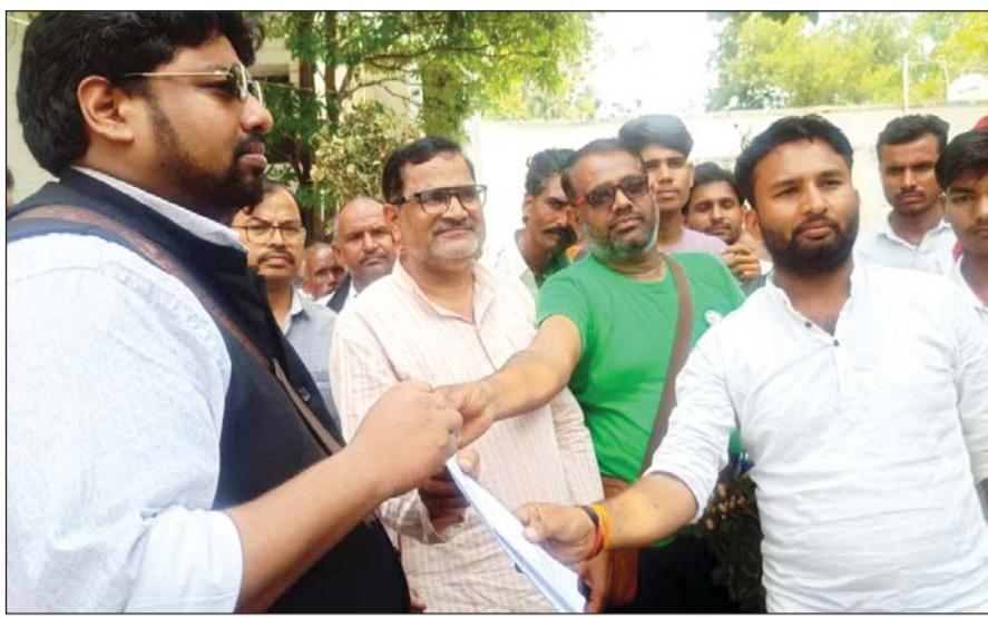
ललितपुर। किसानों के बीच उनकी बात सुनने पहुंचे डीएम।

अतिवृष्टि से फसल-नुकसान का मुआवजा दिलाने का भरोसा दिया