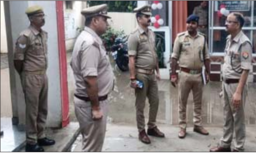
चित्रकूट। थाना राजापुर का आकस्मिक निरीक्षण करते एसपी ।