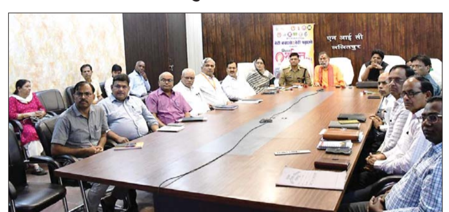
ललितपुर। कार्यक्रम का सजीव प्रसारण देखते अधिकारी।

ललितपुर। शक्ति पर्व शारदीय नवरात्रि पर महिला सुरक्षा, सम्मान एवं स्वावलम्बन को सशक्त बनाने के उद्देश्य से सरकार द्वारा संचालित मिशन शक्ति अभियान के 5वें चरण का शुभारंभ मुख्यमंत्री योगी आदित्यनाथ ने लखनऊ से किया। इसका सीधा प्रसारण जिले में देखा गया।