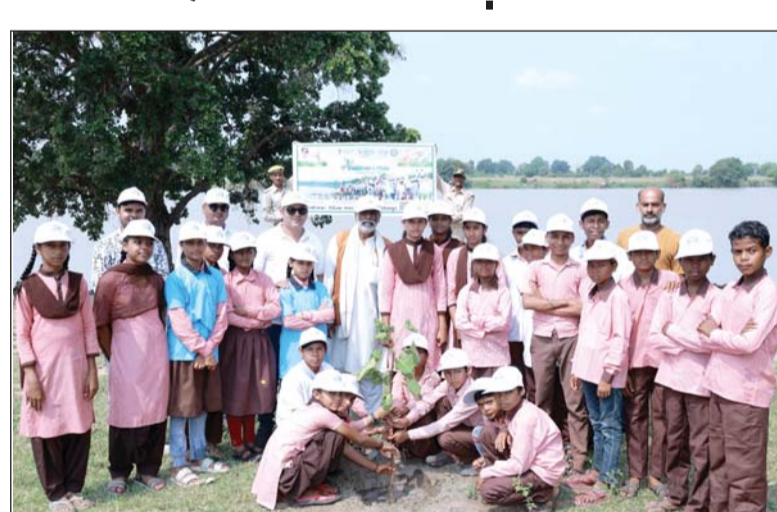
ललितपुर। वेतवा नदी के घाट पर सफाई के बाद पौधरोपण करते विद्यार्थी।

ललितपुर। स्वच्छता ही सेवा पर्व के तहत ऐतिहासिक और धार्मिक महत्व वाले तीर्थ रणछेड़ धाम घाट पर एक विशेष सफाई अभियान चलाया गया।