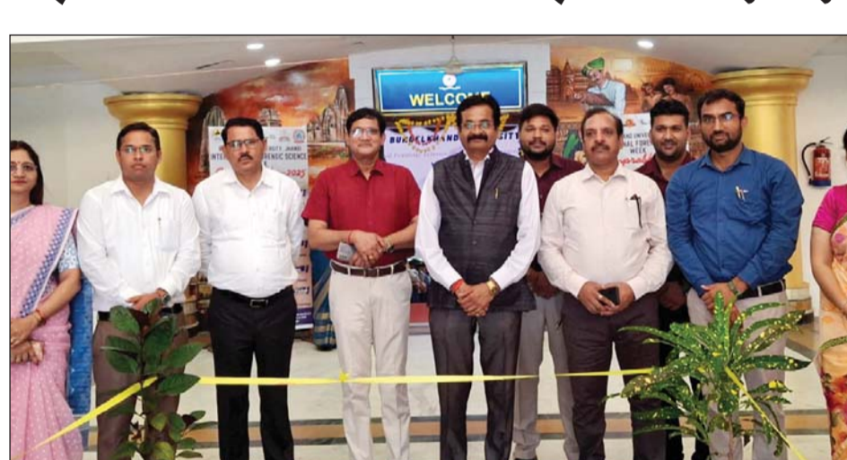
झाँसी जयूस। आज बुँदेलखंड विश्वविद्यालय के फॉरेंसिक विज्ञान विभाग में इंटरनेशनल फॉरेंसिक