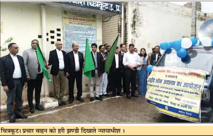
चित्रकूट। प्रचार वाहन को हरी झण्डी दिखाते न्यायाधीश ।

जिला जज समेत अन्य न्यायाधीशों ने दिखायी हरी झण्डी