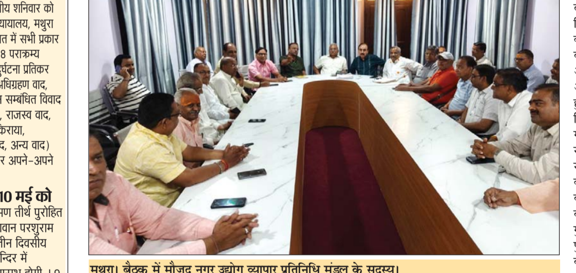
मथुरा। बैठक में मौजूद नगर उद्योग व्यापार प्रतिनिधि मंडल के सदस्य।

वर्तमान कार्यकारिणी का एक साल का कार्यकाल पूरा होने पर हुई बैठक