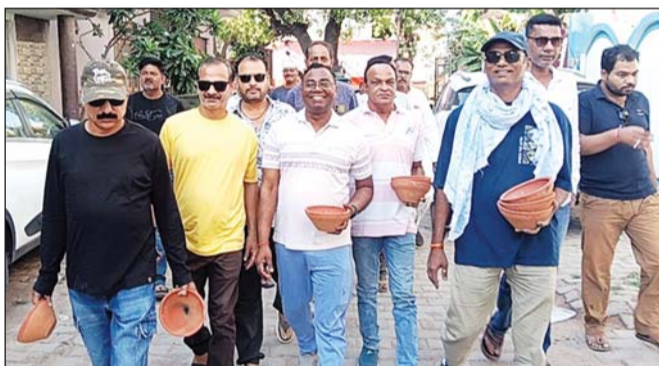
ललितपुर। जलपात्र वितरण करे ईओ और तखत गुप सदस्य।

तखत गुप के साथ ईओ ने भी घर घर बाँटे जलपात्र