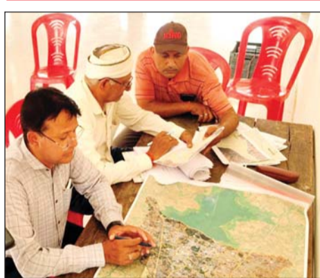
ललितपुर। जनगणना के लिये तय नया कर्मी।

ईओ के नेतृत्व में 52 सुपरवाइजर करेंगे निगरानी