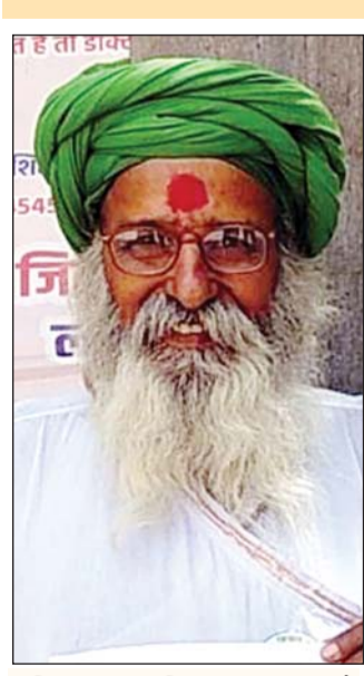
ललितपुर। शिकायत करने कलेक्ट्रेट आये किसान नेता।

फर्जी आधार कार्ड बनाकर करोड़ों की जमीन हड़पने का आरोप लगाया