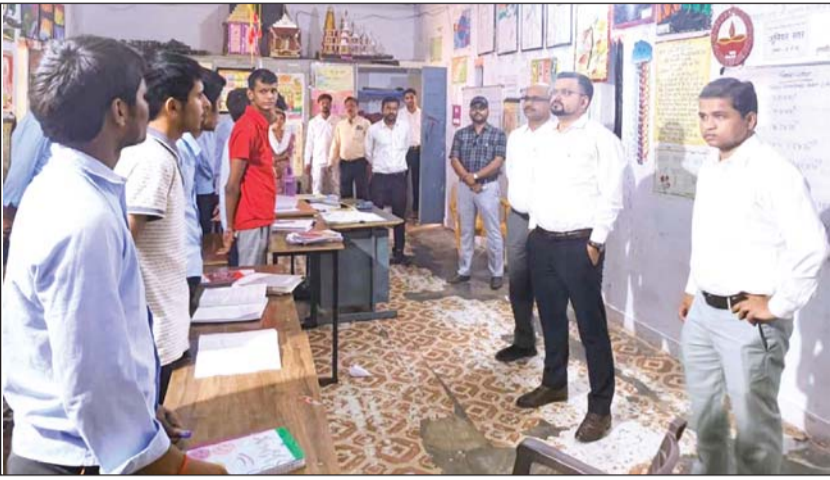
ललितपुर। किशोर गृह का निरीक्षण करती जिला निरीक्षण समिति।

संवासियों के हित में सभी व्यवस्थाएँ दुरुस्त रखने के निर्देश दिये