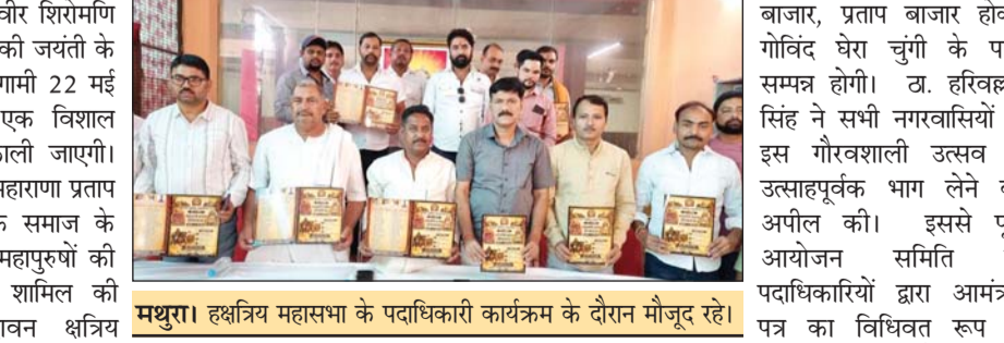
मथुरा। हस्तिय महासभा के पदाधिकारी कार्यक्रम के दौरान मौजूद रहे।

सभी समाज के महापुरुषों की झांकियां होंगी आकर्षण का केंद्र