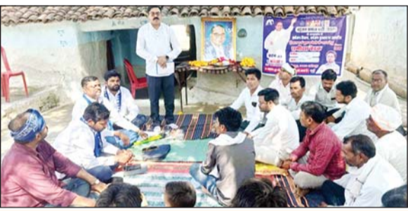
ललितपुर। बैठक में चर्चा करते बसपाई।