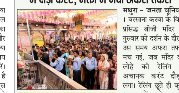
मथुरा। राधारानी मंदिर पर रेलिंग में करंट आने के कारण श्रद्धालुओं को रेलिंग से हटकर दर्शन कराते सुरक्षाकर्मी।

मथुरा - जनता यूनिशन । बरसाना कस्बा के विश्व प्रसिद्ध श्रीजी मंदिर में गुरुवार को दर्शन के दौरान उस समय अफरा तफरी मच गई, जब मंदिर की लोहे की रेलिंग में अचानक करंट दौड़ने लगा। रेलिंग छूते ही कुछ श्रद्धालुओं को झटके महसूस हुए तो वहां मौजूद लोगों में हड़कंप मच गया। सेवायतों और मंदिर कर्मचारियों ने श्रद्धालुओं को रेलिंग से दूर हटाया और फिर दूरी बनाकर दर्शन कराना शुरू कर दिया। घटना के बाद मंदिर परिसर में कुछ देर के लिए भय और असमंजस का माहौल बन गया। श्रद्धालु एक दूसरे को रेलिंग से दूर रहने की चेतावनी देते नजर आए। भीड़ अधिक होने के कारण मंदिर कर्मचारियों को व्यवस्था संधालने में काफी मशकत करनी पड़ी। सूचना मिलते ही मंदिर प्रशासन सक्रिय हो गया और विद्युत कर्मियों को मौके पर बुलाया गया। प्राथमिक जांच में किसी गोष्वासी, फतेह कृष्ण या अर्थिंग की खराबी की आशंका जताई जा रही है। एहतितायत के तौर पर रेलिंग के आसपास विशेष निगरानी बढ़ा दी गई है। मंदिर आने वाले श्रद्धालुओं से लगातार अपील की जा रही है कि वे लोहे की रेलिंग को हाथ न लगाएं और प्रशासन के निर्देशों का पालन करें। उधर घटना के बाद कई श्रद्धालुओं ने मंदिर परिसर में विद्युत सुरक्षा व्यवस्था को लेकर चिंता भी जताई।