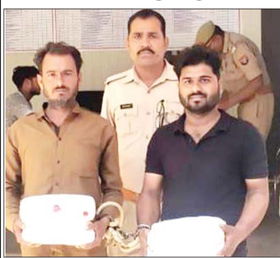
ललितपुर। अवैध गाँजे के पकड़ा गया नरोबाज।

ललितपुर। जनपद पुलिस ने 4 किलो 104 ग्राम अवैध गाँजा मादक पदार्थों की तस्करी के बरामद किया है। गिरोह का एक खिलाफ चलाए जा रहे अभियान के तहत दो आरोपियों को गिरफ्तार किया है। पुलिस ने इनके कब्जे से कोतवाली सदर क्षेत्र की नई बस्ती