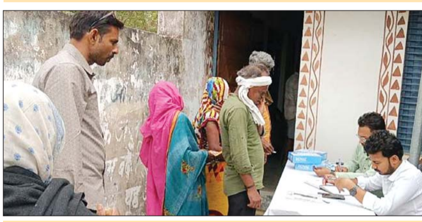
चित्रकूट। मरीज का नेत्र परीक्षण करते चिकित्सक

चित्रकूट। पाठ क्षेत्र अंतर्गत बिजहना कोलान बड़ी मडैन में बुन्देलखण्ड मुक्ति मोर्चा के आयुष्मान स्वास्थ्य केंद्र बिल्डिंग एवं कम्पोजिट विद्यालय सेहरिन तत्वावधान में निःशुल्क नेत्र