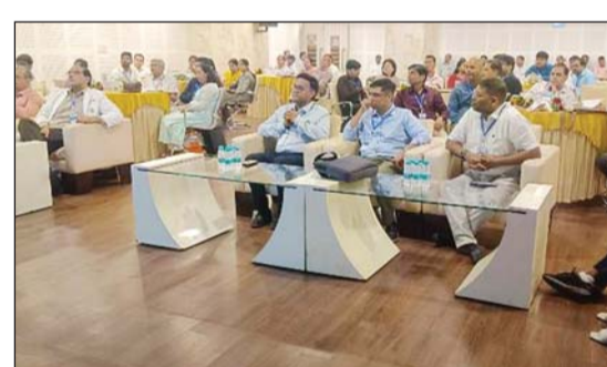
चित्रकूट। कार्यशाला में नेत्र चिकित्सक।