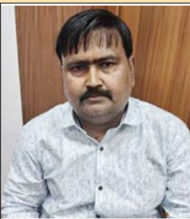
चित्रकूट। पुलिस गिरफ्त में कर्मचारी।

चित्रकूट। भ्रष्टाचार अन्वेषण ब्यूरो के उपर एक और टीम होना चाहिए जो इस टीम की जांच कर सके। सवाल साफ है कि इस टीम के कई ऐसे सदस्य हैं जिनके उपर पहले से भ्रष्टाचार के आरोप हैं जो खुद आरोपी हो वह दूसरे की जांच कैसे कर सकते हैं। सूत्रों की माने तो यह टीम जिसे पकड़ती है पहले वही सेटिंग करने की कोशिश करती है मामला ना सुलझने पर कोतवाली लाकर सीनियर अधिकारियों को अंधेरे में रख कार्य करती है। मामला ना सुलझने पर आरोपी को जेल भेज दिया जाता है। इस टीम में काले रंग का एक चेचक मुंह दाग वाला पैसे की खातिर तेजी दिखा रहा था। इसने संमामनितों को बाहर जाने का आदेश दिया जैसे टीम का कसान हो। टीम का ब्यवहार बेहद डरावना था। कोतवाली ने हालांकि इसे खंडा था।