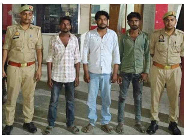
चित्रकूट। पुलिस गिरफ्त में हत्यारोपी।